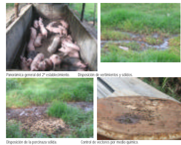
Los residuos sólidos y líquidos se mezclan en la parte inferior, no se les realiza ningún tipo de tratamiento ni estabilización, situación que genera proliferación de vectores sanitarios y otros alérgicos ya que las condiciones existentes en la porcinaza favorece para que la mosca realice el proceso de oviposición y se presente todo el ciclo biológico completo, situación que hace que los niveles admisibles de mosca doméstica sean altos.

Esta instalación fue adecuada para la tenencia de cerdos, ya que era una mini piscina que existía en el predio. Dadas las condiciones locativas es una estructura que no brinda las condiciones mínimas para la tenencia de cerdos, ya que dificulta las actividades de aseo y desinfección eficiente.