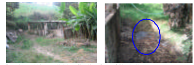
Panorámica general del tercer establecimiento. Disposición de Residuos Sólidos y Líquidos.

TERCER ESTABLECIMIENTO Numero de Cerdos: 30 Tipo de granja: Producción en semi-seco - Ciclo de producción: Levante y engorde.