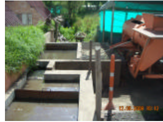
Foto No. 1: Condiciones del sistema de tratamiento, no hay operación, se detectó olor molesto de agua estancada, sin mantenimiento.