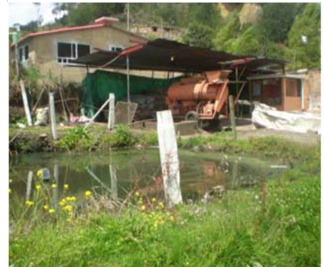
Foto 2. Reservorio de agua proveniente de dos nacimientos para alimentar a las máquinas.

Es notorio que la capacidad de la planta no es suficiente para tratar las aguas residuales provenientes de las dos máquinas, puesto que en el momento que estén operando las dos máquinas al mismo tiempo se puede sobresaturar la planta y presentar taponamientos.