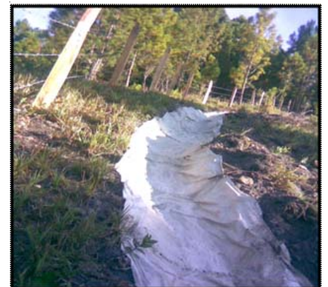
Adecuación del antiguo sitio de disposición final de residuos sólidos.