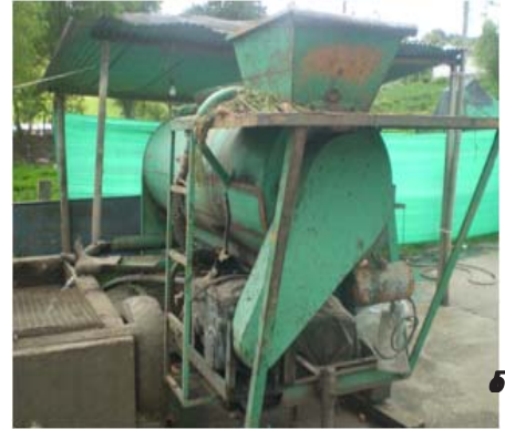
1. Máquina lavadora de zanahoria y papa criolla # 1 (color verde)

Como se puede apreciar el agua utilizada por las máquinas para el lavado de zanahoria y papa criolla supera el caudal concesionado (0.21 litros/seg.) otorgado mediante Resolución de 08 de Mayo de 2006; el señor Benavidez afirma que las dos máquinas operan en promedio 4 horas diarias, dependiendo de la cantidad de zanahoria y papa criolla para lavado.