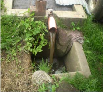
Foto 2. Agua residual generada por la máquina # 2, la cual es conducida por tubería hacia la palanta de tratamiento de aguas residuales.