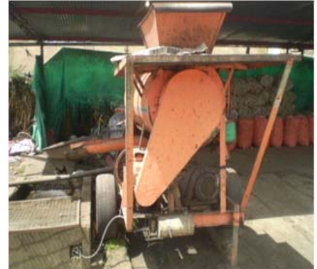
Foto 2. Máquina lavadora de zanahoria y papa criolla # 2 (color naranja)