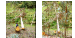
Fotos 5-6. En los tazones y desechos de los (50) árboles talados de Eucalipto se evidencia el buen porte y dimensiones en edad, altura y DAP, con madera vale para aserrijo.