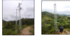
Fotos 13-14. Terrenos para soportar los cables para la ubicación de la nueva línea de interconexión eléctrica.