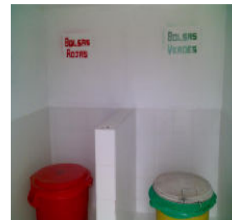
Zona de almacenamiento adecuada, para el manejo de los residuos peligrosos y similares