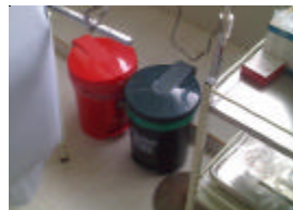
Recipientes para el manejo de los residuos generados en el centro de salud.

• El CENTRO DE SALUD viene realizando la separación de los residuos en tres recipientes plenamente identificados y rotulados, con los colores establecidos para tal fin, verde (orgánicos), gris (inorgánicos) y rojo (Hospitalarios) cada uno con bolsa de igual color, los recipientes están ubicados en los pasillos, salas de espera y consultorios respectivamente, la ruta de recolección de los residuos Hospitalarios se realiza a diario. Para los residuos orgánicos e inorgánicos la recolección es realizada y entregados al carro recolector del municipio.