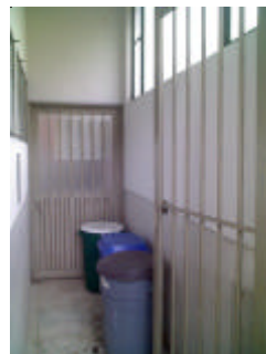
Instalaciones de la zona de almacenamiento de los residuos peligrosos

No se evidencia una adecuada señalización de la ruta de recolección de los residuos.