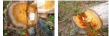
Fotos 7-8. En los tocacos y desechos de los (50) árboles talados de Eucalipto se evidencian el buen porte y dimensiones en edad, altura y DAP, con madera solo para aserrió.