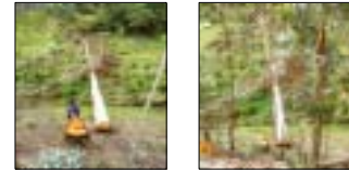
Fotos 5-6. En los tocacos y desechos de los (50) árboles talados de Eucalipto se evidencian el buen porte y dimensiones en edad, altura y DAP, con madera solo para aserrió.