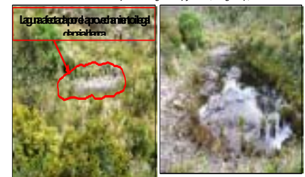
Fig. 13 Lagunas de la vereda Ruche del municipio de Tibaná.