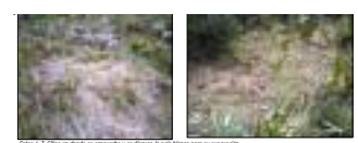
Fig. 16: Se observó el aprovechamiento y el depósito de paja blanca para su comercialización.