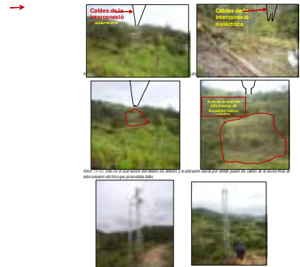
Fotos 9-14. Torres para soportar los cables para la ubicación de la nueva línea de alta tensión eléctrica.