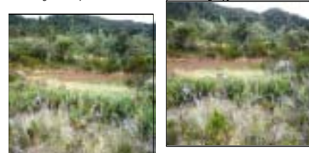
Fig. 14 Lagunas de la vereda Ruche del municipio de Tibaná.